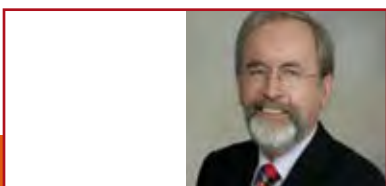
Bürgermeister Rudolf Heß, Stadt Pfullingen

„Wir haben 3 Fußballfelder dazu gewonnen. Mit der Aktivierung eines Teils der Baulücken in unserem Stadtgebiet können wir neue, unterhaltsaufwendige Siedlungserweiterungen einsparen und die vorhandene Infrastruktur besser auslasten.“