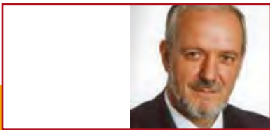
Bürgermeister Ernst Schilling, Stadt Herbolzheim